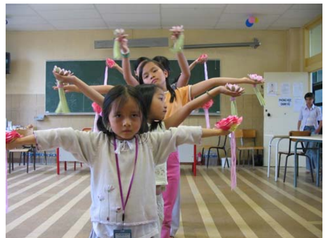
Các em ngành Oanh đang tập vũ chuẩn bị cho đêm văn nghệ trong kỳ khoá học Phật Pháp Âu Châu tại Amiens, Pháp quốc