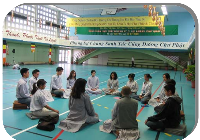
Các em ngành Thiếu đang tập ngồi thiền qua sự hướng dẫn của một Sư Cô trong kỳ khoá học Phật Pháp Âu Châu tại Amiens, Pháp quốc

Các anh chị trách nhiệm đã tìm ra những khó khăn mà trước đây các lớp học đã gặp phải trong vấn đề ăn uống, nên đã giao trách nhiệm cho một huynh trưởng liên lạc trực tiếp với ban trai soạn của khóa học thông qua bởi các Thầy Cô trách nhiệm. Năm nay các em được chú ý và được ưu đãi không ngờ. Ngoài các món ăn như thường lệ, các em đã được hỏi: muốn ăn món gì hãy đề nghị với ban trai soạn. Mì gói hay khoai tây chiên, nhiều khi còn được thưởng thức những món đặc biệt. Các huynh trưởng chia phiên đi lấy món ăn về và phân phối cho cả lớp. Các em đã được hướng dẫn niệm Phật trước và sau bữa cơm và tập ăn uống 10 phút trong chánh niệm. Sau khi lo cho các em xong, các huynh trưởng mới bắt đầu dùng bữa. Thấy các anh chị thương và lo lắng nên các em cũng đáp lại là hết sức vâng lời. Điều mà các anh chị trưởng hết sức mong muốn.