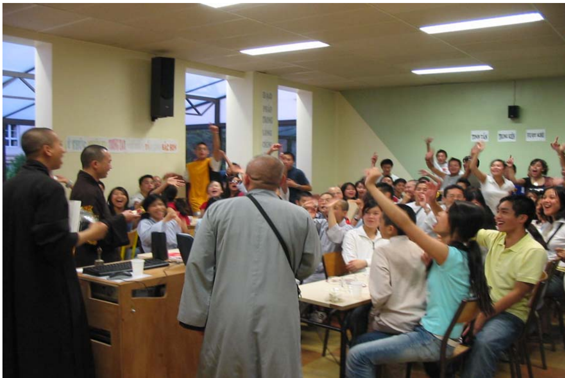
Đồ vui để học và được phần thưởng của quý Thầy, thì ngành Thiếu và ngành Thanh rất là hăng hái :-). Khoá học Phật Pháp Âu Châu tại Amiens, Pháp quốc.