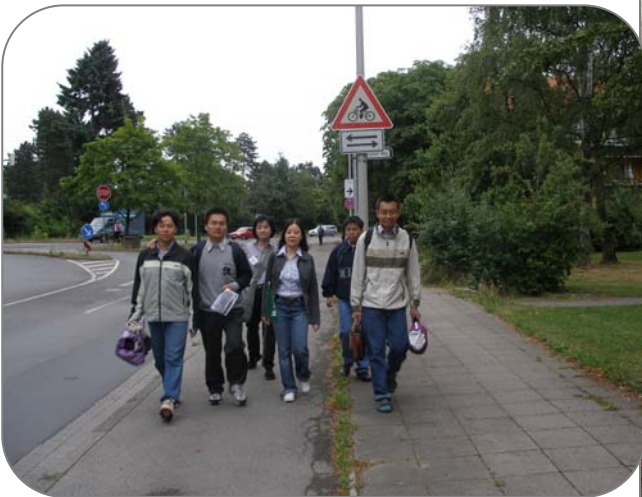
Đội Vô Trụ Xứ