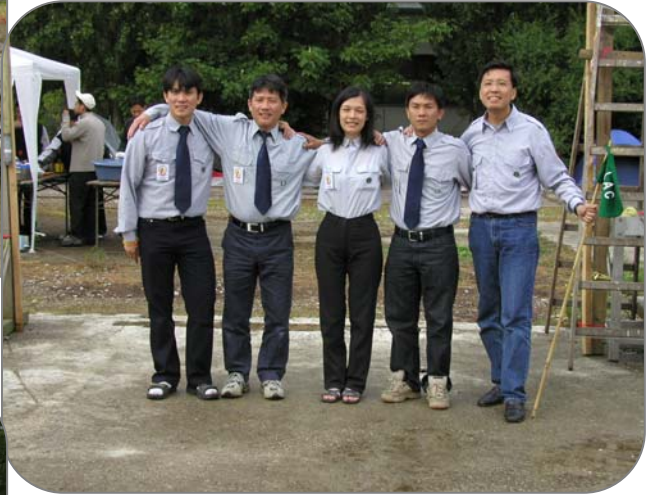
Đội Bồ Đề Hành