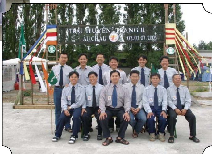
Nam trại sinh Trại Huyền Trang 2