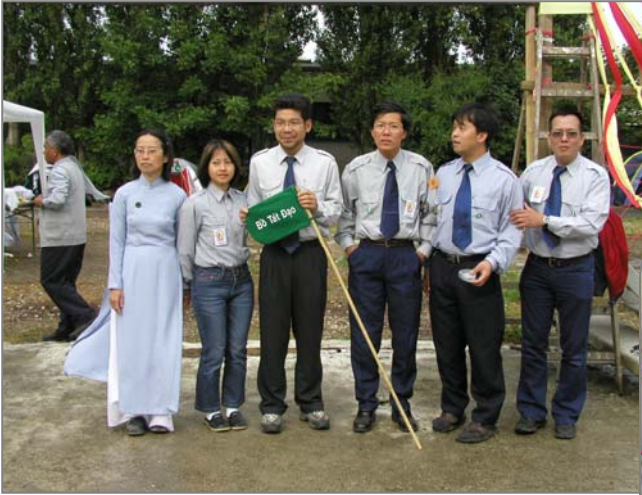
Đội Bồ Tát Đạo