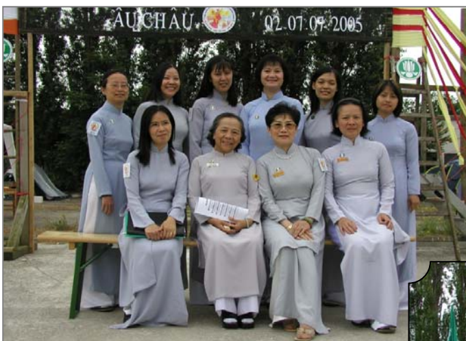
Nữ trại viên Trại Huyền Trang 2