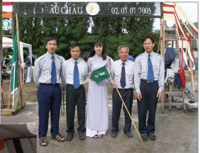
Đội Tự Tánh