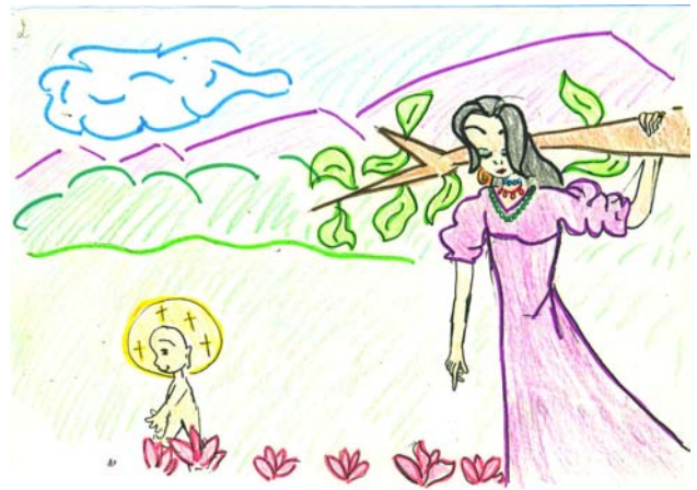
2- Sinh ra Hoàng tử

Ngày xưa ngày xưa, ở một nước bên Ấn độ, xảy ra một câu chuyện làm thay đổi cả thế giới. Trong một giấc ngủ, hoàng hậu Ma-gia, vợ của vua Tịnh-Phạn (Suddhodana) nằm mơ thấy một chuyện lạ lùng : hoàng hậu thấy một con voi trắng đẹp lắm, có sáu ngà, từ trên trời xuống, đẹp, thật đẹp. Con voi chui vào bụng hoàng hậu, từ đó hoàng hậu có bầu.