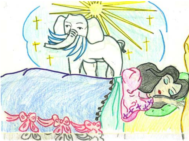
1 - Một giấc mơ lạ lùng.

Chuyện này các em được nghe ông nội (ngoại) của các em là cụ Giác Nguyên - Đặng Quốc Quân kể về nội dung và các em thuật lại. Mời các em theo dõi.