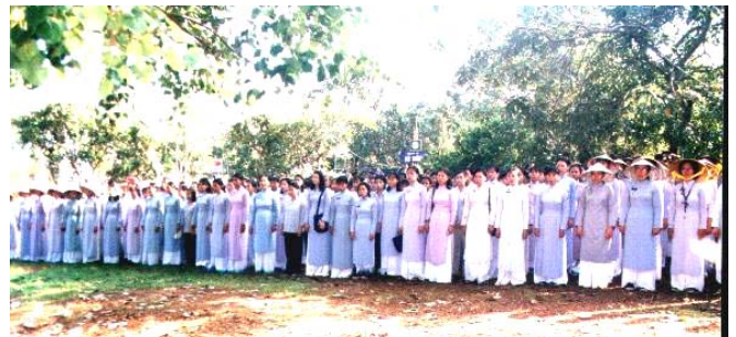
Ngày Hạnh miền Quảng Đức Sài gòn - Gia Đình trong kỳ trại Tâm Chánh (4/11/2001)