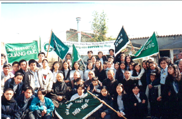
Đại Hội Thường Niên GDPT VN tại Nantes, chùa Vạn Hạnh