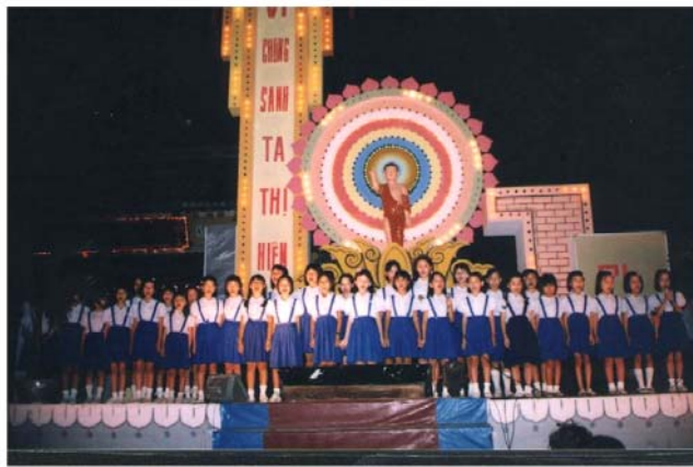
Lễ Vu Lan năm 2001 tại Đà Nẵng do các đơn vị GDPT Liên Hoa và Tâm Chánh thực hiện.

Sau lễ bế mạc các em quay quần bên nhau và kết dây thân ái trong tình Lam thắm thiết. Vẫn biết rằng con người luôn bị chi phối và thay đổi theo thời gian cùng hoàn cảnh sống nhưng anh chị vẫn mong muốn