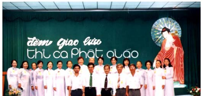
Các anh trong BHD Đà Nẵng và phía sau là các chị trong Đoàn Nữ Tâm Chánh đó.